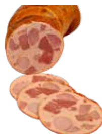
Saucisson de Paris en boyau naturel