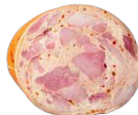
Saucisson de Paris en boyau artificiel

Le saucisson de Paris artisanal offre une qualité exceptionnelle et une expérience gustative authentique. De la couleur alléchante et de la texture lisse à l'odeur et à la saveur raffinées, ce saucisson cuit montre qu'il a été fabriqué avec soin et savoir-faire. La teneur en sel équilibrée et l'assaisonnement subtil contribuent à une expérience gustative harmonieuse, et la sensation en bouche est douce et agréable. Ce saucisson cuit est un produit de haute qualité, que tant le connaisseur que l'amateur sauront apprécier. À recommander à toute personne qui veut déguster et apprécier la saveur d'un saucisson cuit artisanal.